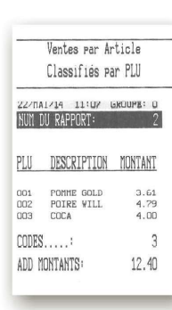
Ventes par article